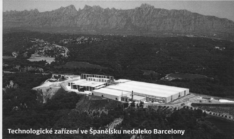
Technologické zařízení ve Španělsku nedaleko Barcelony

V Německu, které má velmi přísné ekologické normy, funguje 51 zařízení, která ročně zpracují 3,9 milionu tun směsného komunálního odpadu, Rakousko má 16 zařízení s kapacitou 0,8 mil. tun, Polsko disponuje 11 zařízeními zpracujícími ročně 0,5 milionu tun. Další příklady máme ve Španělsku, kde nedaleko Barcelony úspěšně funguje MBÚ zařízení s kapacitou 365 tisíc tun směsného komunálního odpadu ročně, nebo v italském Miláně, kde od roku 1997 pracuje zařízení s kapacitou 600 tisíc tun ročně.